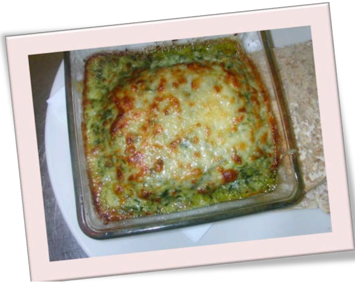
Lasagne végétarienne (aux épinards) 9.20 euros